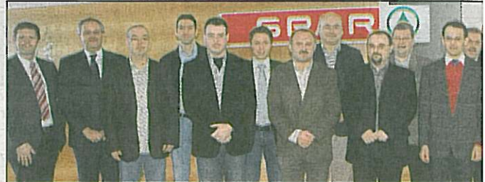
Die Vorarlberger SPARler führten die Besucher aus Ungarn durch die modernen SPAR-Märkte im Land.

Leitende Mitarbeiter von SPAR Ungarn waren zu Gast in Vorarlberg. Ziel des Besuchs war ein Erfahrungsaustausch, um in Vorarlberg ein lokales und regionales Marketing nach dem Vorbild der SPAR Vorarlberg aufzubauen. Nach einem Workshop der SPAR-Zentrale Dornbirn statteten die Besuche Besichtigungen der modernen EUROSPAR- und INTERSPAR-Märkte auf dem Programm. Besondere Höhepunkte fanden die erfolgreichen Verhandlungen mit Lieferanten und die Besuche in Vorarlberg. In Vorarlberg SPAR-Geschäften werden über 100 Produkte mit Herkunft aus Vorarlberg angeboten.