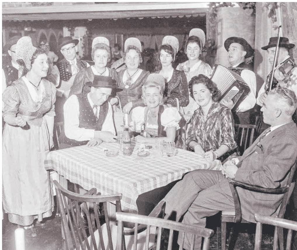
Dornbirn, Weinfest im Parkhotel, 1961

Das Vorarlberg-Quiz mit historischen Bildern.