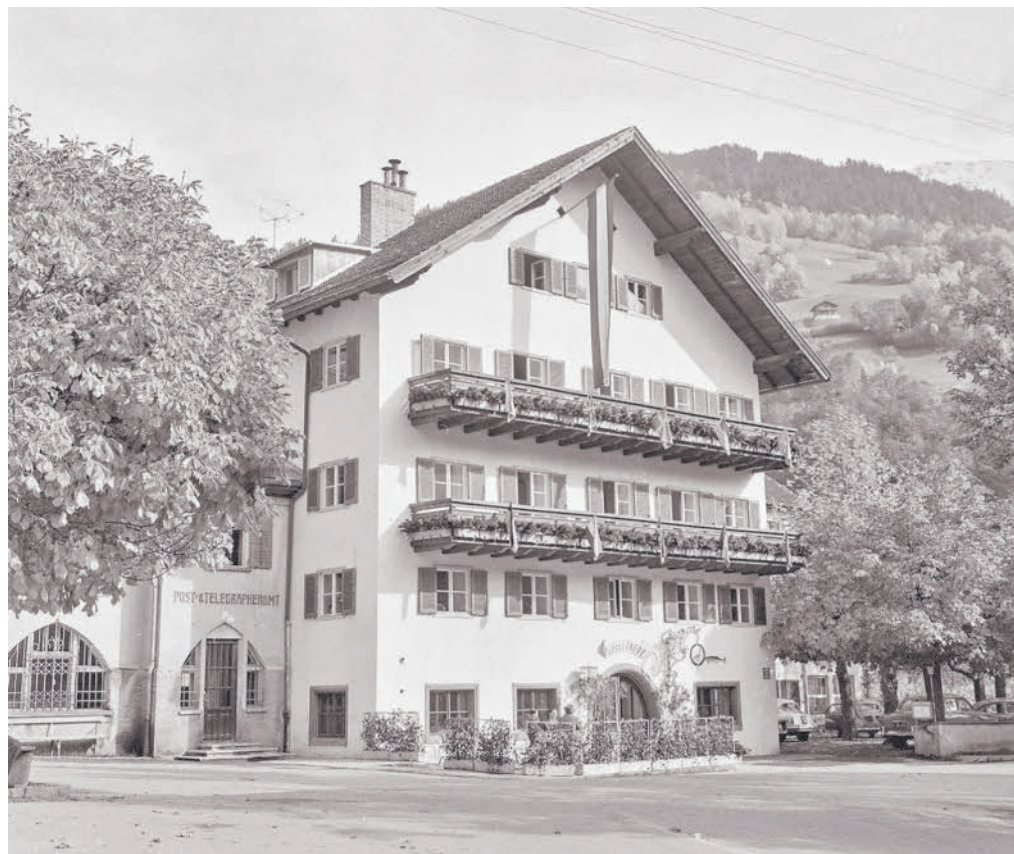
Schnruss, Hotel Tubel, 1960