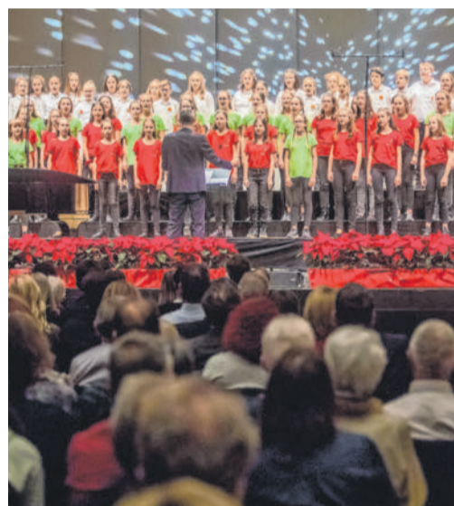
Die „Ma hilft“-Gala gibt es auch heuer nicht auf der Bühne, sehr wohl aber im Herzen.

Sobald sich eine innerfamiliäre Situation zuspitzt, werden freilich die Profis herangezogen. Die Aufgaben des Kinderdorfs in der Familienarbeit wurden in den vergangenen Jahren immer mannigfaltiger. Auch das hat die Organisation mit „Ma hilft“ gemeinsam. Als Partner in gemeinsamen Missionen sind beide noch effizienter. VN-HK