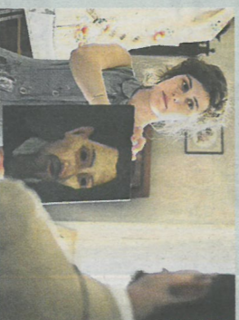
Regie: Christian Schwchow

Paula – Mein Leben soll ein Fest sein Regie: Stanley Weber, Carla Jun, Roxane Duran Heute ist sie weltberühmt: die deutsche Malerin Paula Modersohn-Becker. Zu ihren Lebzeiten war das anders. Ihr verbitterter Kampf um künstlerische und persönliche Selbsterfüllung schweißte. Als sie mit gerade mal 31 Jahren starb, nahm kaum jemand Notiz von ihrem Schaffen. Inzwischen gelten ihre Werke als Meisterwerke der Kunst.