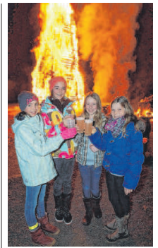
Winter ade Wo die Funken brennen /E5