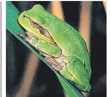
Der Laubfrosch ist im Land stark gefährdet.

gramme bereitstellen. Kritik aus Brüssel gab es indes auch wegen der Umverteilung von Flüchtlingen aus Griechenland und Italien auf andere EU-Länder. Diese geschehe immer noch zu schleppend, meint die Kommission. /A2